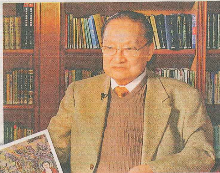
在納斯達克上市的在線遊戲開發商搜狐暢遊，斥資2,000萬元人民幣，以取得金庸(上圖)的10部著作之手機遊戲獨家改編權；小圖為其中一部小說《天龍八部》。(資料圖片)

【明報專訊】金庸武俠小說描述的仙風道骨、風花雪月不僅令書迷愛不釋手，更是科網公司垂青的生財法寶。在納斯達克上市的在線遊戲開發商搜狐暢遊，斥資2000萬元人民幣，以取得金庸10部著作的手機遊戲獨家改編權。此外，近期內地科網尋寶潮迭起，內地網絡公司奇虎360昨日亦證實，正商議併購搜狐旗下的搜索引擎搜狗。分析員稱科網併購潮中將出現部分不理性的交易，或將科網泡沫進一步發大。